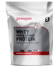
WHEY TRIPLE SOURCE PROTEIN