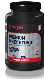
PREMIUM WHEY HYDRO